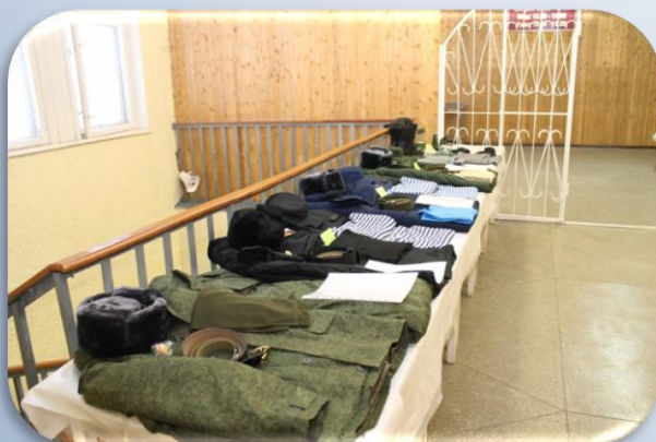
Получение вещевого имущества