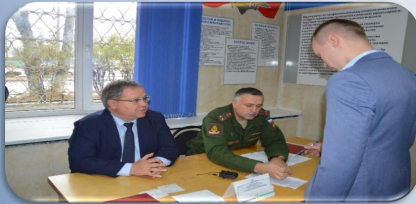
Заседание призывной комиссии МО ГО «Сыктывкар»