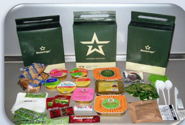
Получение ИРП на путь следования