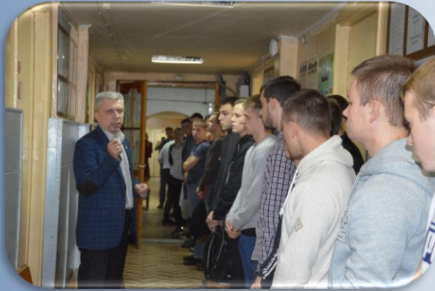
Инструктаж призывников на призывном пункте