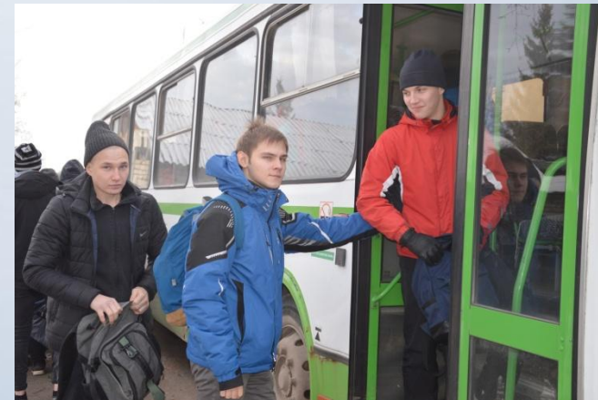
Отправка призывников на РСЦ