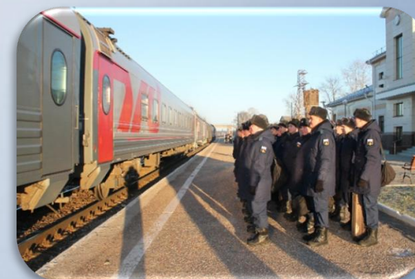
Убытие к месту прохождения службы