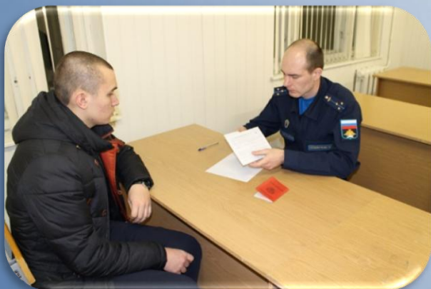
Изучение представителями воинских частей