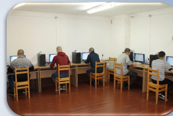
Тестирование для определения профориентации